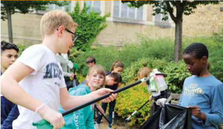
Belle action citoyenne de la commission environnement du Conseil Municipal des Enfants, qui a nettoyé les alentours de l'Hôtel de Ville.