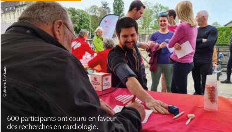
600 participants ont couru en faveur des recherches en cardiologie.