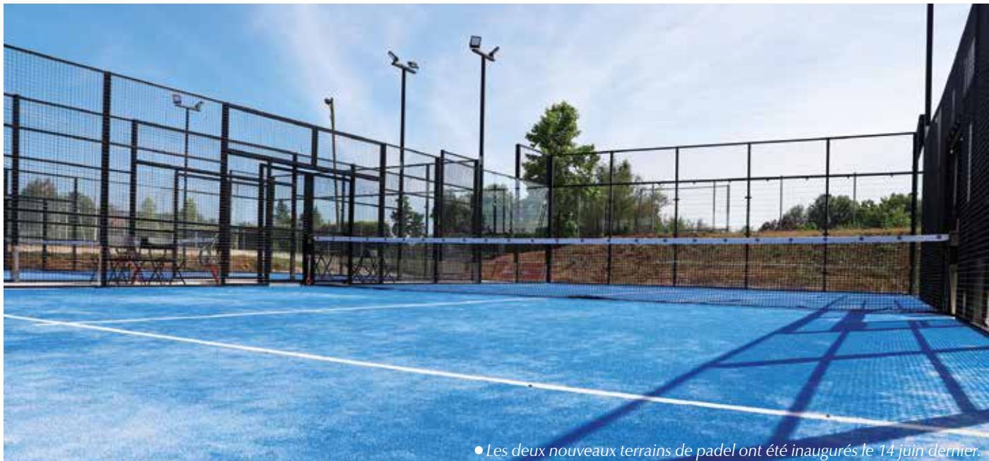
• Les deux nouveaux terrains de padel ont été inaugurés le 14 juin dernier.

La Ville de Dole, en partenariat avec le Tennis Club Dolois, vient de finaliser la construction des deux nouveaux terrains de padel situés sur le site du club local. Un aménagement attendu, qui verra l'apparition d'une des premières écoles de padel de la région.