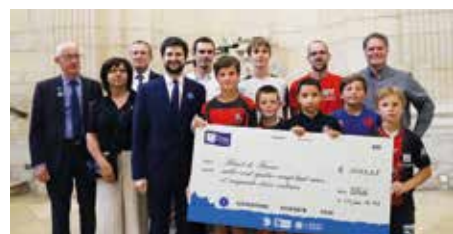
• Les jeunes de l'US Dole très impliqués dans cette collecte.

Toujours dans l'optique de sensibiliser la population aux valeurs républicaines et au devoir de mémoire pour les victimes de conflits, la Ville de Dole a souhaité apporter son soutien aux actions de la Fondation du Bleuet de France en organisant des collectes de fonds du 22 avril au 7 mai dernier. Cette œuvre caritative nationale accompagne les blessés de guerre, les victimes de terrorisme et leurs familles dans leur vie quotidienne depuis 1946. Né au cœur de la Première Guerre Mondiale, le Bleuet de France reste un véritable symbole de solidarité, fièrement arboré lors des commémorations mémorielles, et vient en aide à ceux qui restent : les conjoints, les enfants, ainsi qu'à tous les soldats blessés. La Ville de Dole et le Souvenir Français ont collecté 1 188 € de dons, dont le chèque, qui sera remis à l'œuvre du Bleuet de France, a été présenté à l'issue de la commémoration de l'appel du 18 juin 1940.