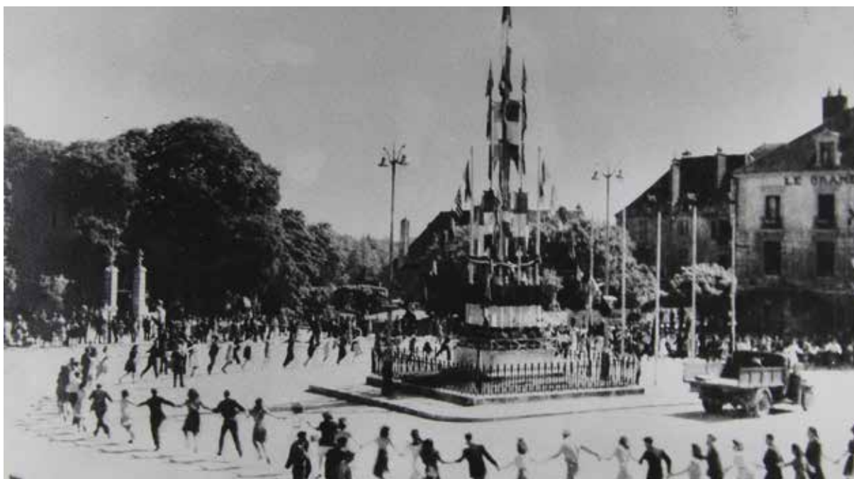
● La liesse a envahi Dole le 9 septembre 1944.

Le 9 septembre 1944, après 50 mois d'occupation par l'armée nazie, les Dolois peuvent enfin respirer et se laisser porter par la liesse de la Libération. 80 ans et 3 générations plus tard, la Ville de Dole, engagée dans des actions d'Engagement, de Mémoire et de Citoyenneté, se prépare à célébrer cet événement historique et à rendre hommage à tous les héros qui ont combattu et donné leur vie pour notre liberté.