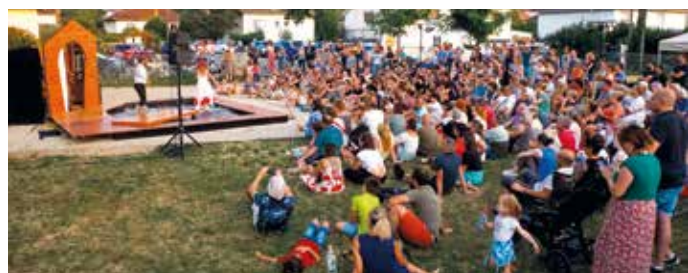
● Mardi d'été à Azans en 2023.

Retrouvez toute la programmation sur sortiradole.fr