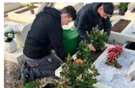
• Les élèves du collège M. Bastie à l'ouvrage.

Une fois cette importante rénovation terminée, les élèves de la section horticulture du Collège Maryse-Bastie de Dole, se sont également investis dans le projet et ont mis en valeur les travaux réalisés, en ornant chaque tombe de jeunes rosiers.