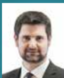
Jean-Baptiste Gagnoux Maire de Dole

“Travailler à la promotion de la citoyenneté auprès des jeunes générations est indispensable. Les actions mises en œuvre permettent chaque année de promouvoir la transmission de la mémoire, la découverte des institutions, le sens de l'engagement au service d'autrui. Les premières actions sont une réussite encourageante, avec notamment une promotion 2024 du SNU très impliquée, que je tiens de nouveau à féliciter.”