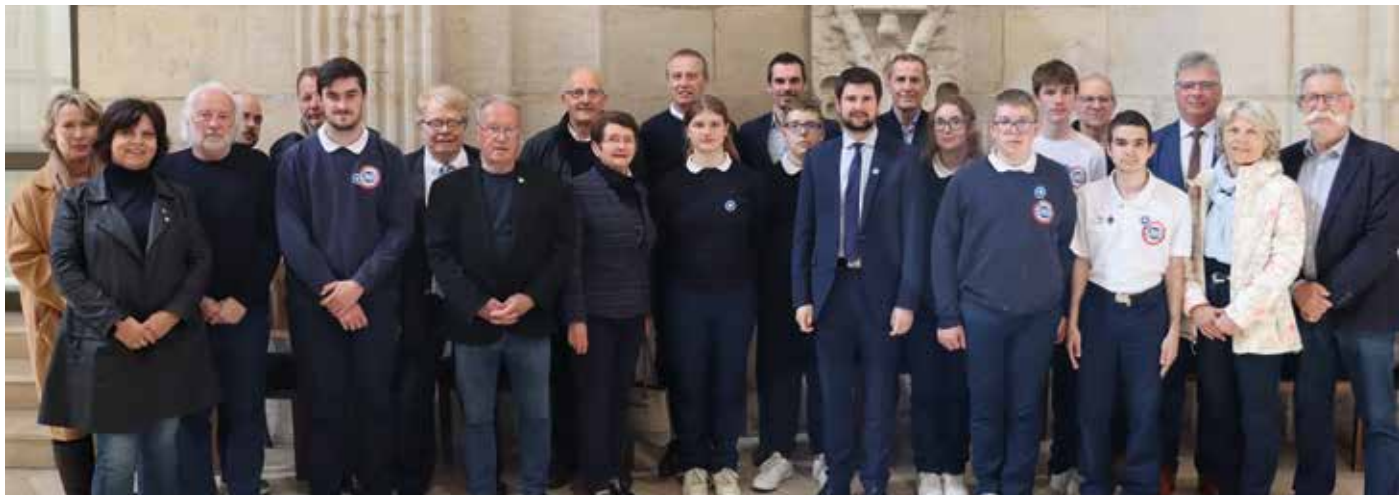
• Les jeunes volontaires du SNU entourés des élus de la Ville et des partenaires de l'opération.

Approuvée lors du Conseil Municipal du mois de mars 2024, la Ville de Dole a décidé de s'impliquer dans la mise en place d'une série d'actions pour mettre en avant les valeurs d'engagement, de transmission de la mémoire et de citoyenneté auprès des jeunes. Présentation.