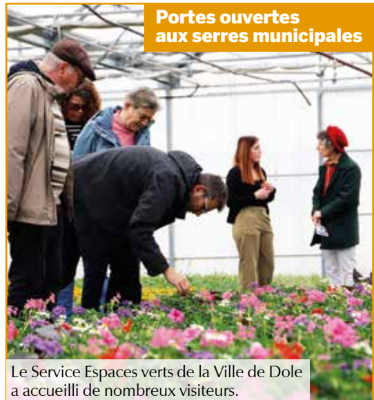
Le Service Espaces verts de la Ville de Dole a accueilli de nombreux visiteurs.