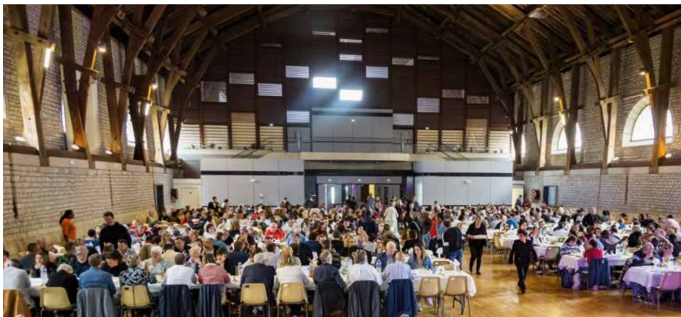
• ÉTAPES a célébré ses quarante ans au Manège de Brack.