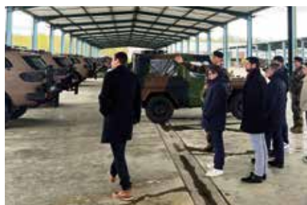
• Visite du 511 e Régiment du Train.